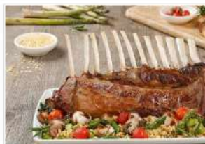
Chuletazo de isabel con timo