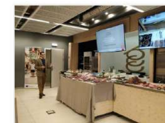
Los secretos de la Carne de Caza Silvestre, al alcance de los futuros profesionales de la hostelería del Basque Culinary Center