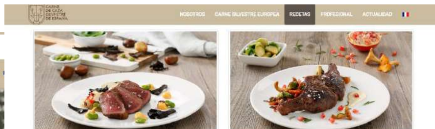
Pave de ciervo con puré de l