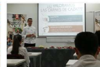
Los alumnos de la Basque Culinary Center descubren el potencial gastronómico de la Carne de Caza Silvestre